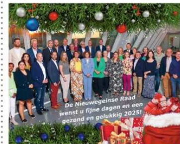
De Nieuwegeinse Raad wenst u fijne dagen en een gezond en gelukkig 2025!

Wij danken u hartelijk voor de belangstelling het afgelopen jaar en hopen u in het nieuwe jaar weer te mogen verwelkomen. ●