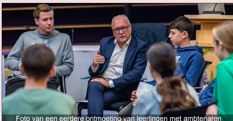
Foto van een eerdere ontmoeting van leerlingen met ambtenaren