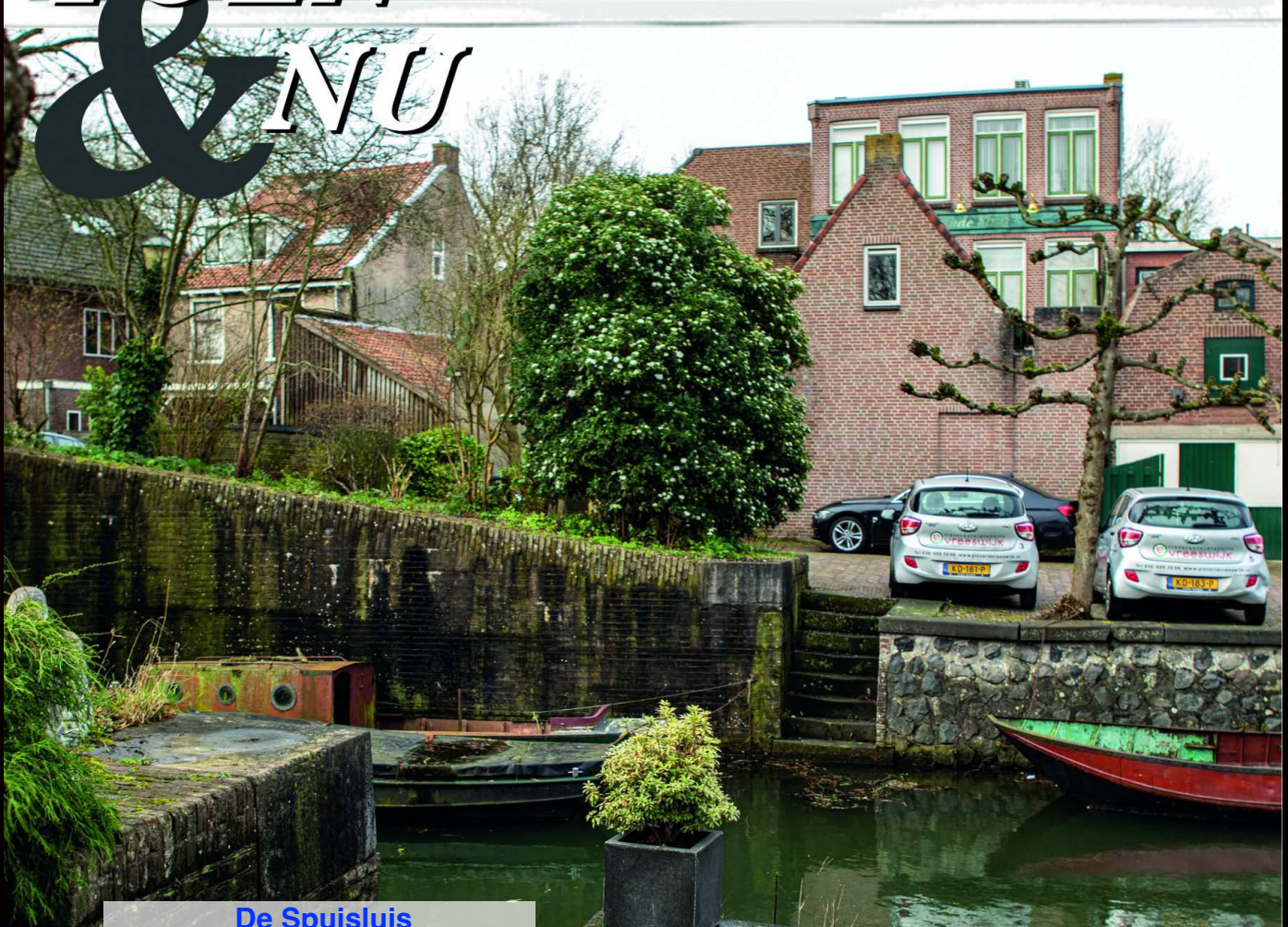
De Spuisluis aan het Frederiksoord