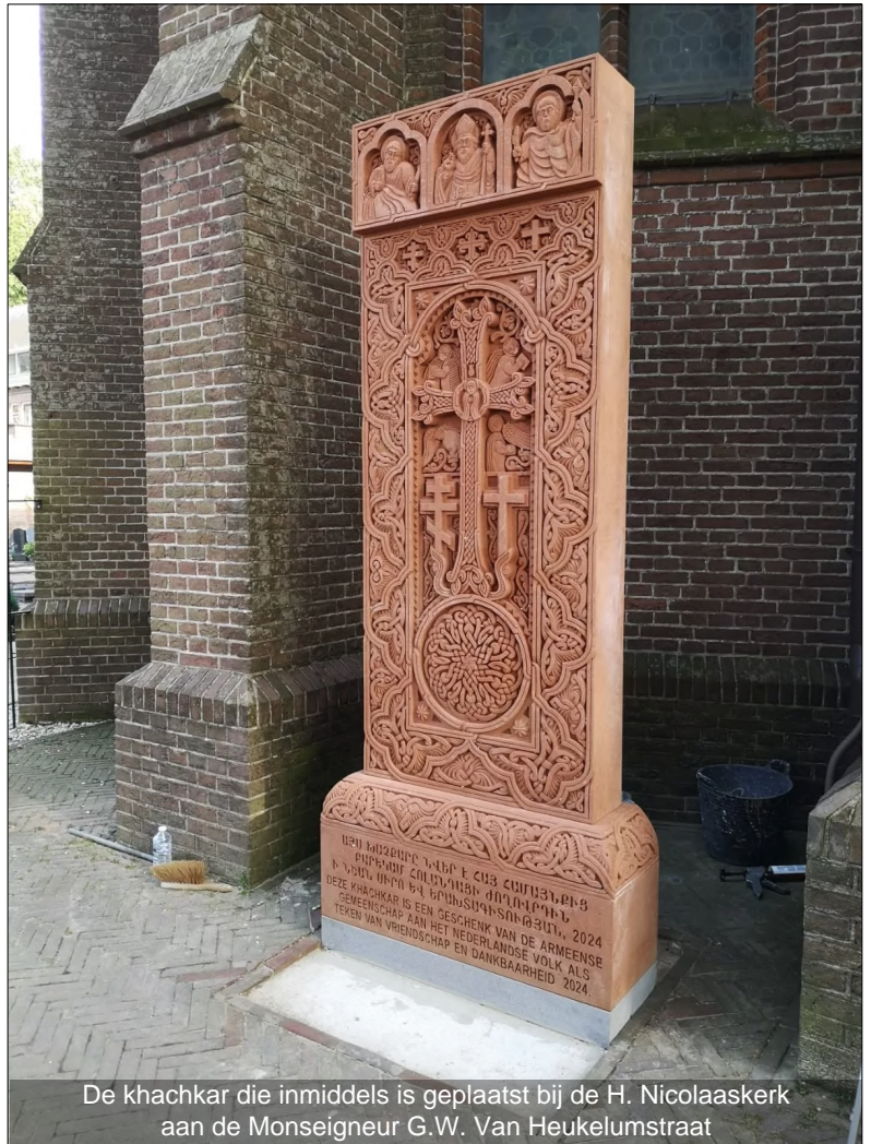
De khachkar die inmiddels is geplaatst bij de H. Nicolaaskerk aan de Monseigneur G.W. Van Heukelumstraat

Uw dierbare herinneringen digitaal Ravenswade 54A in Nieuwegein