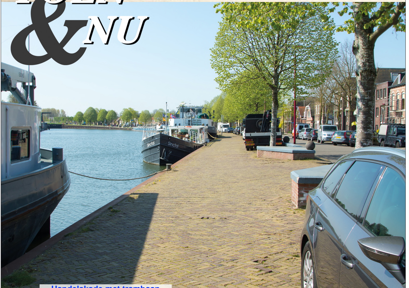
Handelskade met trambaan