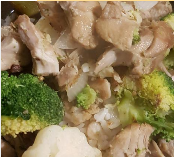
Groene curry met kippendijen, rijst, bloemkool en broccoli ( het recept )