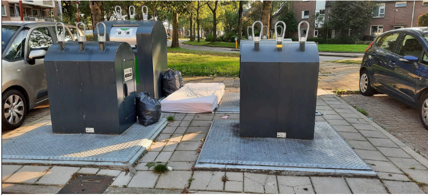
Hartekreet van een Nieuwegeiner die gééft om zijn buurt