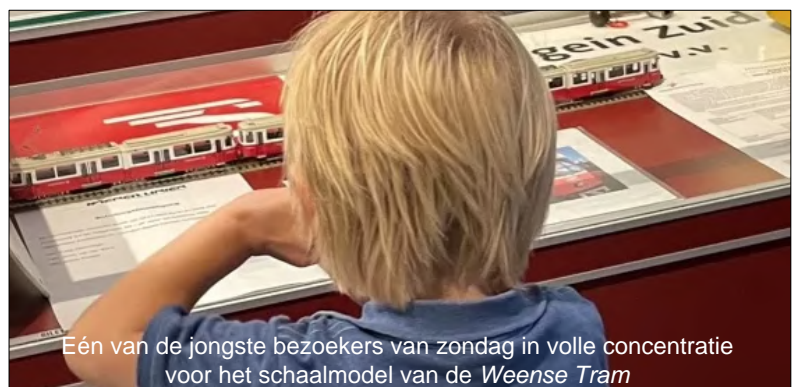
Eén van de jongste bezoekers van zondag in volle concentratie voor het schaalmodel van de Weense Tram

Voor wie de expositie 40 Jaar Sneltram nog wil bezoeken, dat kan tot 5 januari volgend jaar. Museum Warsenhoeck is bereikbaar via de omlidingsroutes die te zien zijn op de website van het museum: www.museumwarsenhoeck.nl .