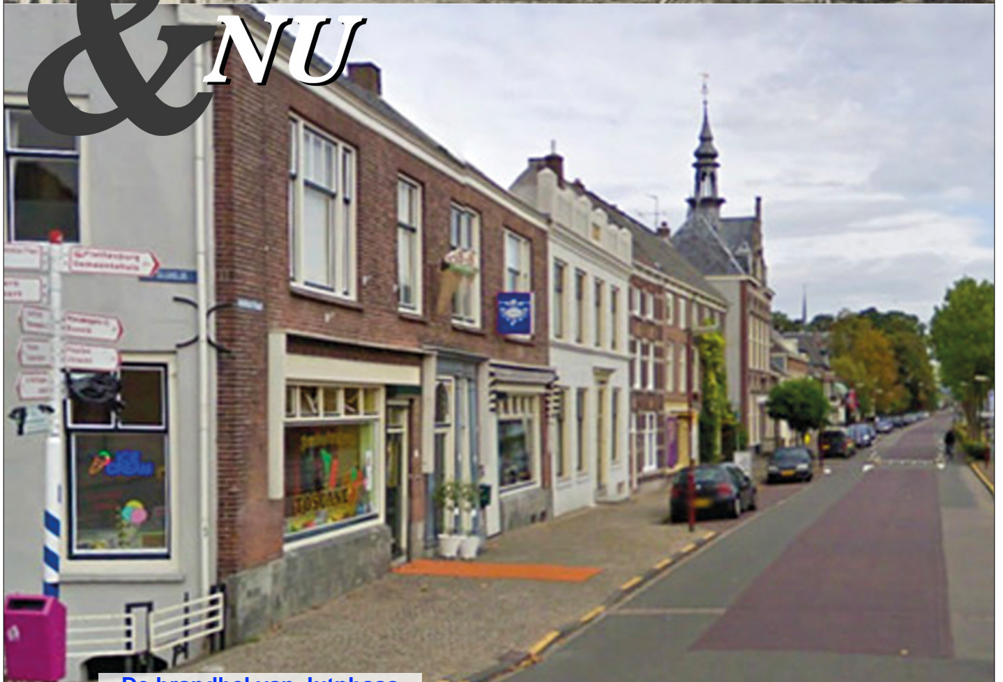
De brandbel van Jutphaas