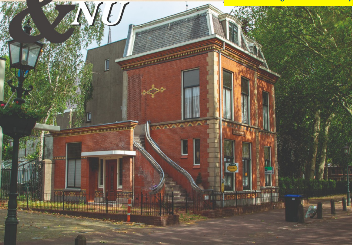
'De Tolgaarder' in Vreeswijk