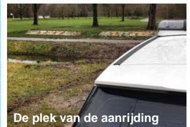
De plek van de aanrijding

Bij de aanrijding zondag 19 januari jl. is één van de betrokkenen doorgereden zonder gegevens achter te laten. Dit betrof een oudere man op een scooter. De zwarte scooter was voorzien van rode letters aan de voorzijde.