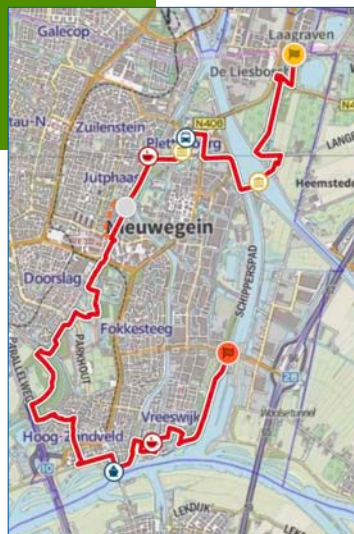
De 14e etappe van het Waterliniep pad

Tijdens de 14e etappe van het Waterliniep pad, een etappe dwars door Nieuwegein, passeer je Fort bij Jutphaas, een langgerekt fort uit 1820 waarna je mag wandelen in een van de mooiste stadsparken van Nederland: Park Oudegein. Er staan bijzondere bomen en het is de groene long van Nieuwegein met water, bossen en een prachtig uitzicht van