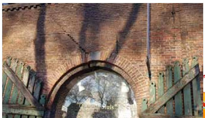
van de gevel en de breuk.

De eigenaren worden door bouwtoezicht gewezen op hun onderhoudsplicht en zorgen voor herstel van de breuk bij de poort naar de balkenloods. Ook wanneer deze niet wordt verkocht moeten zij deze op den duur herstellen.