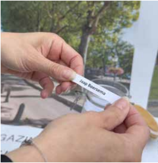
De winnaar van editie 2 2024.