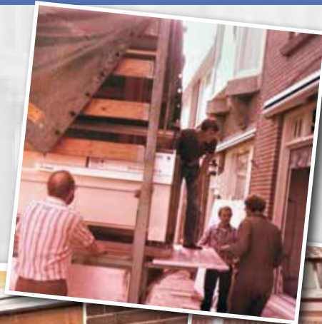
Augustus 1980, één van de verbouwingen van de slagerij.